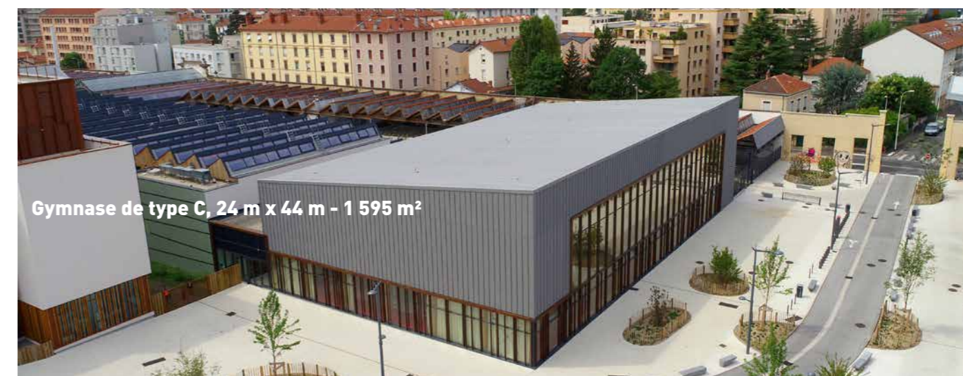
Gymnase de type C, 24 m x 44 m - 1 595 m 2

Le gymnase a été construit par la SEPR grâce aux concours du Programme d'Investissements d'Avenir, de la Caisse des dépôts et consignations (CDC), de la Région Auvergne Rhône-Alpes, de la Métropole de Lyon et de la Caisse d'Épargne Rhône Alpes.